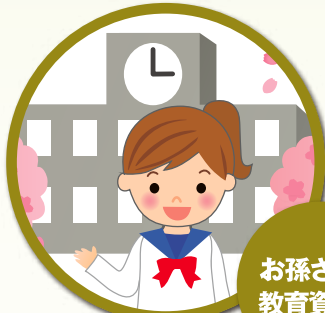
お孫さんの教育資金に